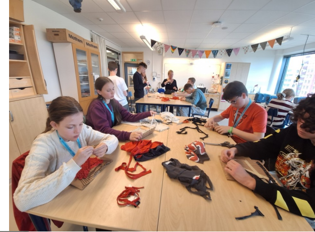
Des ateliers couture...