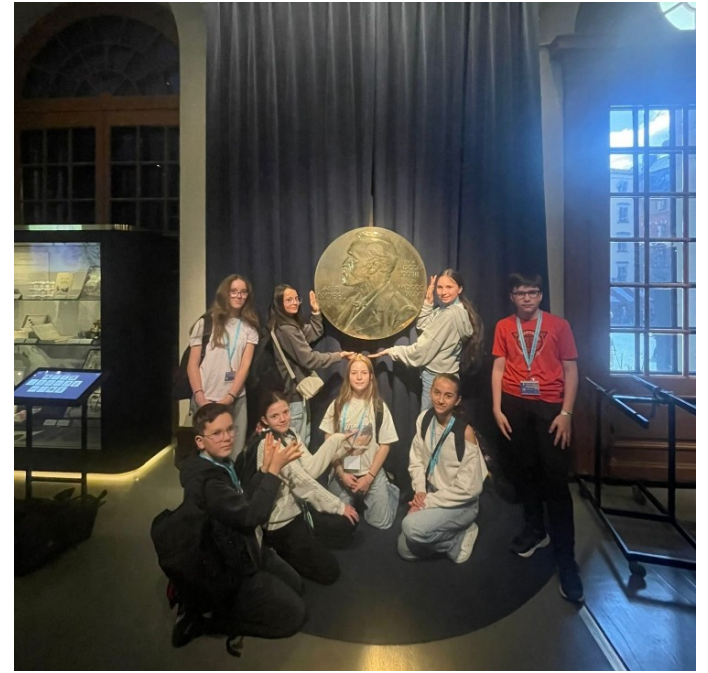
Et si on obtenait le prix Nobel ...