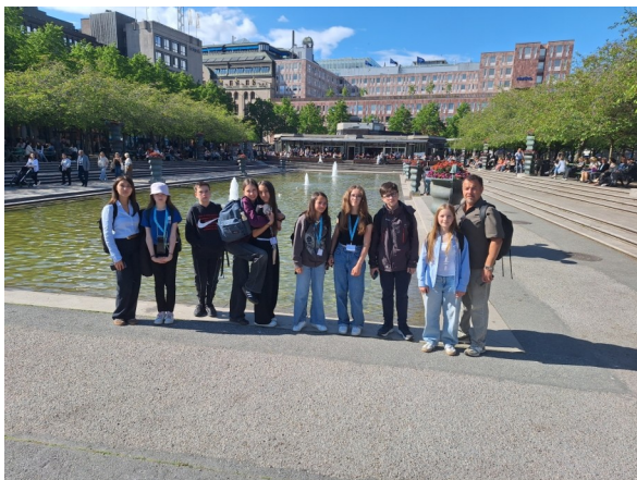
Des visites dans les quartiers modernes .....

L'appartenance à une Europe unie et... un diplôme erasmus