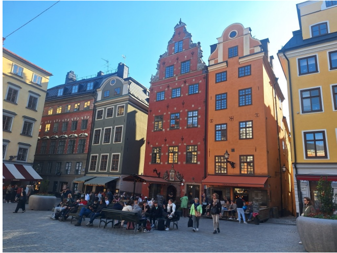
Des visites dans les quartiers typiques .....