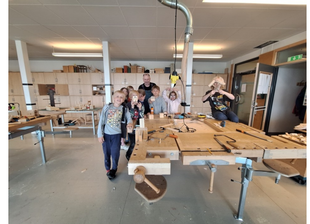
Des ateliers cuisine, menuiserie....