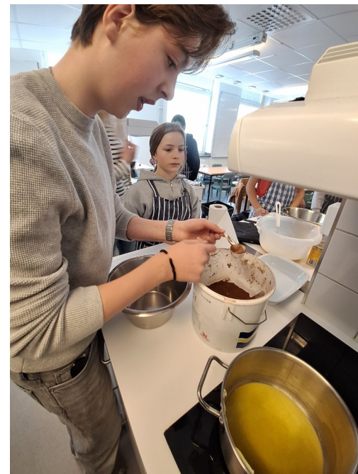
Des ateliers dans l'école comme des élèves suédois....