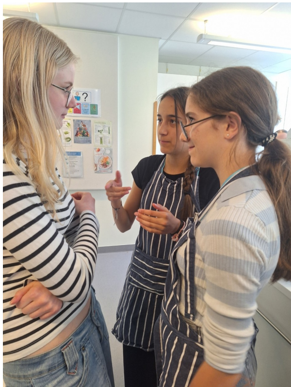
Des conversations multilingues...