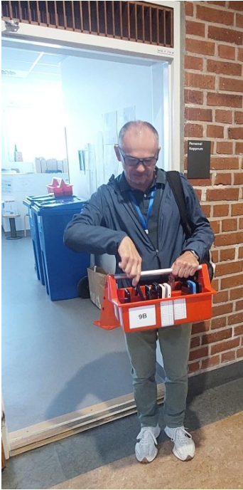
Jouer le prof suédois...