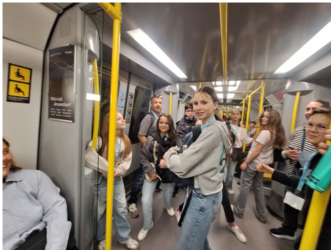
Beaucoup de déplacements (métro, marche, bus, tramway, trotinette...)