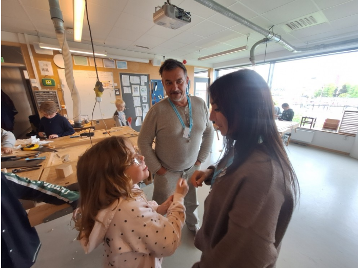
Des discussions entre profs et élèves .....