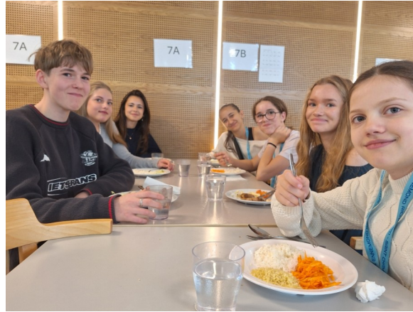
Une semaine au collège...