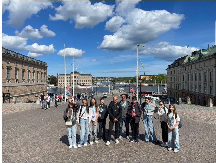
Renforcer l'esprit de groupe et la solidarité